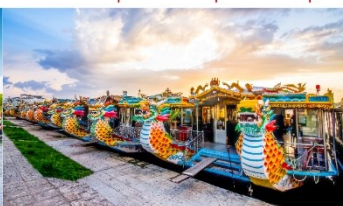
ล่องเรือมังกร