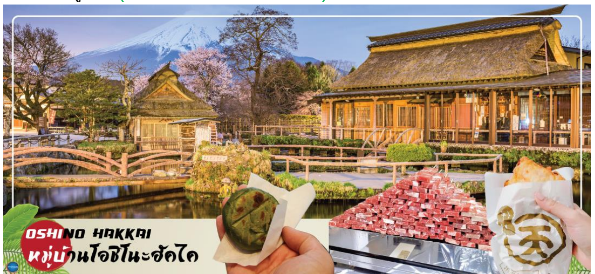
OSHINO HAKKAI หมู่บ้านโอชิโนะฮักไค

นำท่านเข้าสู่ที่พัก (ใช้เวลาเดินทางประมาณ 20 นาที)