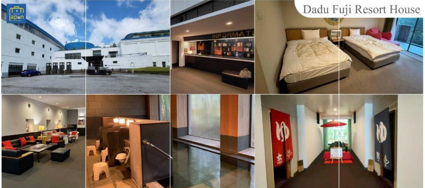
Dadu Fuji Resort House

หลังอาหารให้ท่านได้ผ่อนคลายกับการแช่น้ำแร่ธรรมชาติ เชื่อว่าถ้าได้แช่น้ำแร่แล้ว จะทำให้ ผิวพรรณสวยงามและช่วยให้ระบบหมุนเวียนโลหิตดีขึ้น