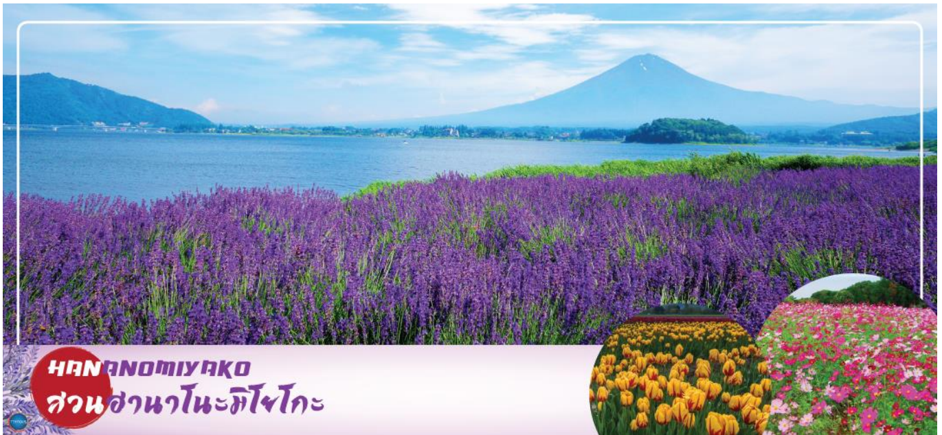
HANANOMIYAKO สวนसानะโนะมียาโกะ

เมืองยามานาชิ – สวนดอกไม้सानะโนะมียาโกะ หรือ เทศกาลชมดอกลาเวนเดอร์ที่ทะเลสาบ คาวากุจิ (ตามฤดูกาล) – พิธีชงชาญี่ปุ่น – กรุงโตเกียว – ย่านโอไดบะ – ห้างไดเวอร์ซิตี – เมืองนาริตะ – อีออนมอลล์ นาริตะ