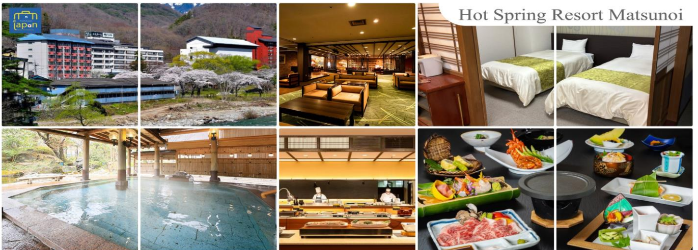
Hot Spring Resort Matsunoi

รับประทานอาหารเช้า ณ ภัตตาคาร ของโรงแรม (2) --- บุฟเฟต์นานาชาติ หลังอาหารให้ท่านได้ผ่อนคลายกับการแช่น้ำแร่ธรรมชาติ เชื่อว่าถ้าได้แช่น้ำแร่แล้ว จะทำให้ ผิวพรรณสวยงามและช่วยให้ระบบหมุนเวียนโลหิตดีขึ้น