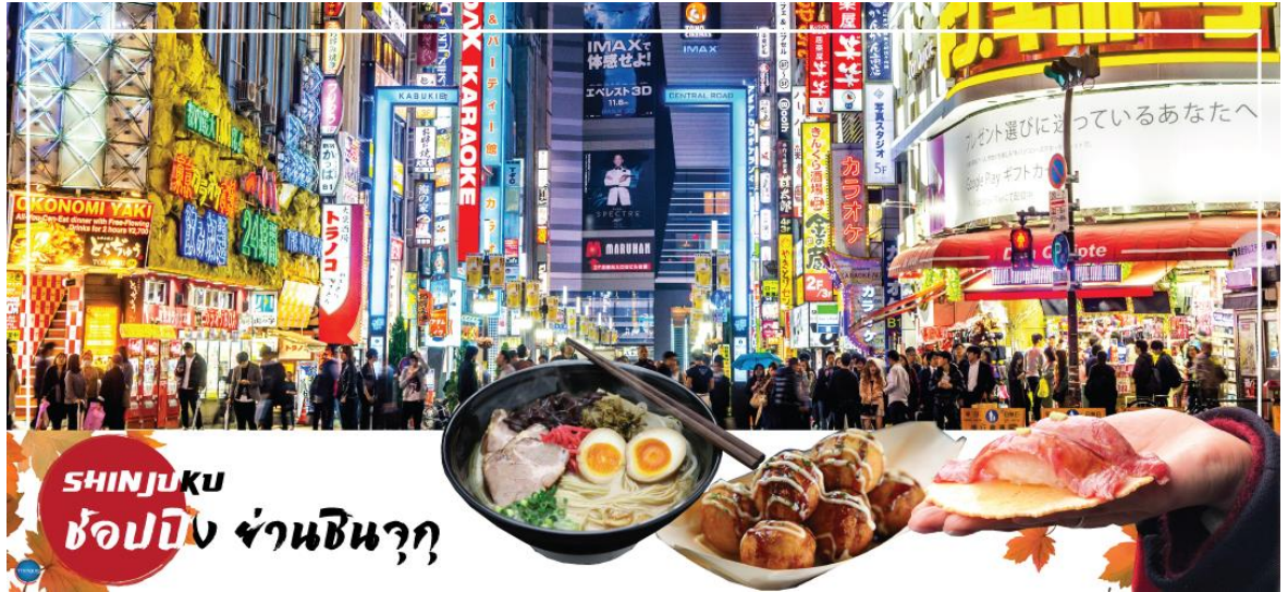
SHINJUKU ช้อปปิ้ง ย่านชินจูกุ

154 ตารางเมตร (1,664 ตารางฟุต) เสียงที่ออกจากลำโพงคุณภาพเกรดดี ความละเอียดภาพระดับ 4K ถือเป็นเทคโนโลยีระดับสูง ที่ให้ภาพเสมือนจริงปรากฏเป็นภาพแนวเหมียวเดินเล่นไปมาอยู่เหนือกรุงโตเกียว นอกจากเมวยักษ์แล้ว ท่านยังสามารถรับชมโฆษณาต่างๆ ที่ถูกครีเอทให้เป็นภาพ 3 มิติ ผ่านจอแอลอีดีนี้ ไม่ว่าจะเป็น แพนด้า, รองเท้าไนกี้, น้องหมา Pompompurin, จานบิน UFO แม้แต่หุ่นยนต์เครื่องดูดฝุ่น ท่านสามารถรับชมและเก็บภาพได้ตามอัธยาศัย