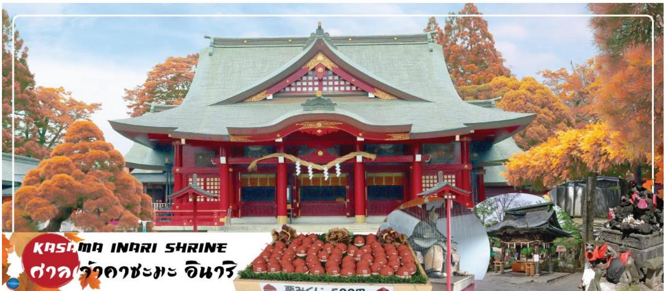
KASAMA INARI SHRINE ศาลเจ้าคาซามะ อินาริ

วันที่สาม เมืองอิบารากิ – ศาลเจ้าคาซามะ อินาริ – จังหวัดไซตามะ – ย่านเมืองเก่าคาวะโกเอะ – ดรอกูกวาด – จังหวัดยามานาชิ – หมู่บ้านโอชิโนะฮัคโค – ออนเซ็น + ชาบูยักษ์