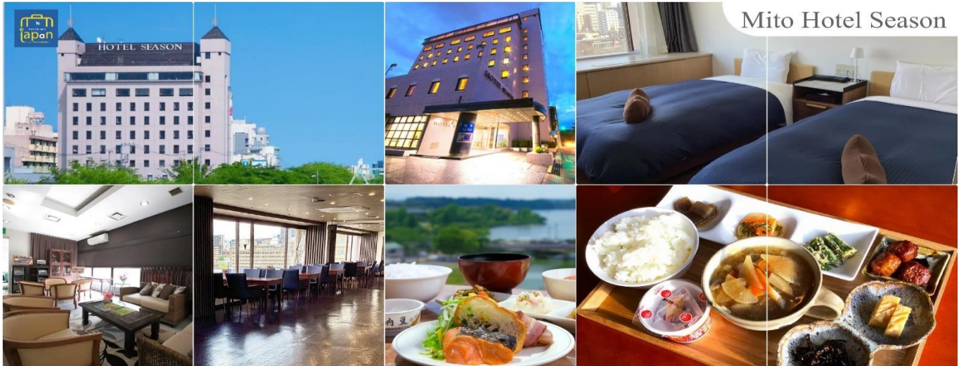
Mito Hotel Season

รับประทานอาหารเย็น ณ ภัตตาคาร (2) MITO HOTEL SEASON, IBARAKI หรือระดับเดียวกัน