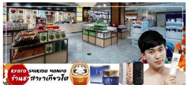
KYOTO SHIKIDO HONPO ร้านชาเกียวโต

นำท่านสู่ ศาลเจ้าเฮอัน (Heian Shrine) ศาลเจ้าแห่งนี้นั้นถูกสร้างขึ้นเพื่อให้ระลึกถึงจักรพรรดิความมั่งคั่งและจักรพรรดิโคเมอิ ผู้ที่มีความสำคัญต่อเมืองเกียวโตอย่างมาก เนื่องจากเป็นจักรพรรดิองค์แรกและองค์สุดท้ายของเกียวโตโดดเด่นด้วยสถาปัตยกรรมในยุคเฮอัน โดยเฉพาะเสาและประตูโทริอิยักษ์สีแดงที่ตั้งอยู่ด้านหน้าของวัด มีสีแดงสดใสมองเห็นมาแต่ไกล จากนั้นสัมผัสวัฒนธรรมดั้งเดิม