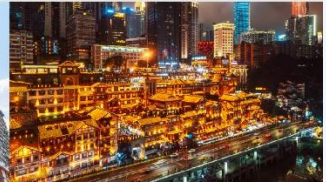
หงหยาดัง(ตอนกลางคืน)

*ทางบริษัทฯ ขอสงวนสิทธิ์ในการสลับโปรแกรมทัวร์ตามความเหมาะสมขึ้นอยู่กับสถานการณ์หน้างาน โดยคำนึงถึงผลประโยชน์ของลูกค้าเป็นสำคัญ