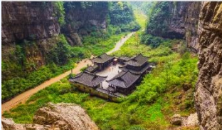
อุทยานหลุมฟ้าสะพานสวรรค์