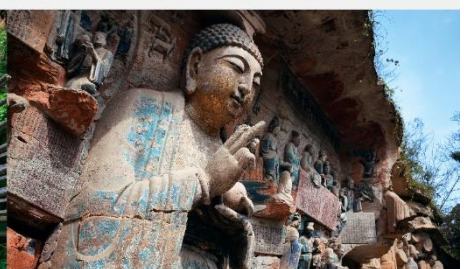
ผาหินแกะสลักต้าจู้ เขาเป่าตึงซาน