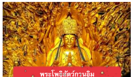
พระโพธิสัตว์กวนอิม

เช้า บริการอาหารเช้า ณ ห้องอาหารของโรงแรม นำท่านเดินทางสู่ มรดกโลกอุทยานผาหินแกะสลักต้าจู๋ ศิลปะหินแกะสลัก อันล้ำค่าแห่งเมืองฉงชิ่งมรดกโลกที่องค์การยูเนสโกขึ้นทะเบียนเมื่อปี ค.ศ. 1999 ตั้งอยู่ทางตะวันตกของนครฉงชิ่ง ประเทศจีน ศิลปะหินแกะสลัก เหล่านี้สร้างขึ้นตั้งแต่ราชวงศ์ถังจนถึงราชวงศ์ซ่ง มีอายุมากกว่า 1,000 ปี โดดเด่นด้วยงานแกะสลักทางพุทธศาสนาที่งดงามและยังคงสภาพสมบูรณ์ (ใช้เวลาเดินทางประมาณ 1-2 ชั่วโมง)