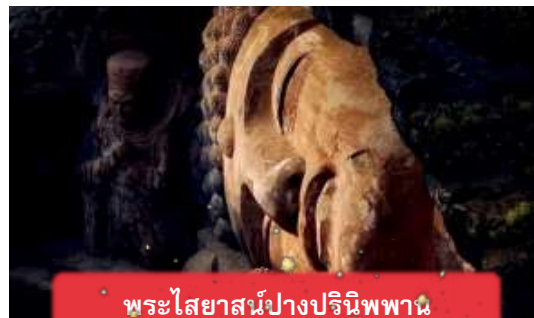
พระไสยาสน์ปางปรินิพพาน