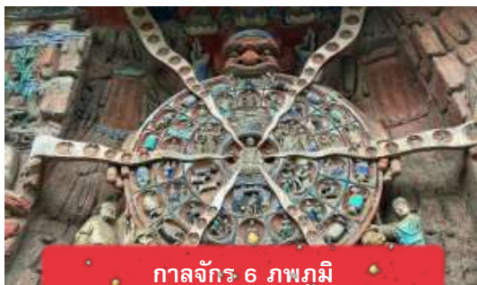
กาลจักร 6 ภพภูมิ