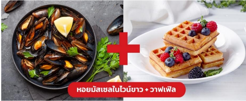
หอยมัสเซลในไวน์ขาว + วาฟเฟิล

Highlight! หอยมัสเซลอบมาในซอสไวน์ขาวสุดกลมกล่อมผสานกับความหวานของหอย เสิร์ฟพร้อมคู่กับเบลเยียม วาฟเฟิล (Belgain Waffle) เป็นเมนูตัดเลี่ยนที่ทานแล้วลงตัวสุดๆ 😊