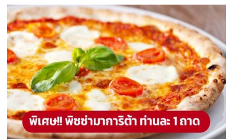
พิเศษ!! พิซซ่ามาการิตต้า ท่านละ 1 ถาด

เย็น ๑๐ รับประทานอาหารเย็น ( เนื้อที่ 2 ) ที่พัก: Novotel Venice Mestre Castellana หรือระดับใกล้เคียงกัน (ชื่อโรงแรมที่ท่านพักทางบริษัทจะทำการแจ้งพร้อมใบนัดหมาย 5-7 วัน ก่อนวันเดินทาง)