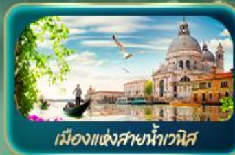
เมืองแห่งสายน้ำเวนิส

จุดรวบรวมความอลังการของธรรมชาติ Dolomites และ ทะเลสาบมิซูร์น่า ชมน้ำสีเทอร์ควอยซ์ ทะเลสาบเบรียส สูดโรแมนติกเมืองแห่งสายน้ำเวนิส ห้ามพลาด มหาวิหารดูโอโมแห่งมิลาน โรบิน อาร์น่า บ้านของจูเลียต เกี่ยวลูเชิร์น ชมสิงโตหินแกะสลัก เดินเล่นสะพานไม้ชาเปล อินส์บรุค ย้อนอดีตกับเสาชนต์แอนน์ หลังคาทองคำ ซ็องปูโจ้ Outlet