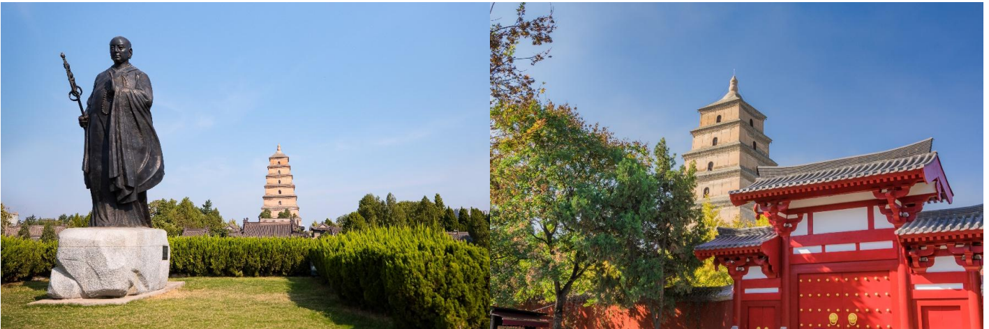
กว่าพันเล่ม

จากนั้นนำท่านเดินทางสู่ เจดีย์ห้าชั้นปาใหญ่ แห่งวัดฉือเอิน สร้างเสร็จในปีค.ศ. 652 โดย ถังเกาจง(หลี่จื้อ) อ่องเต๋อจกัที่สาม แห่งราชวงศ์ถัง และได้นิมนต์พระภิกษุสวนจั้ง หรือรู้จักในนามพระถังซัมจั๋ง พระเถระที่มีชื่อเสียงที่สุดในสมัยถัง ซึ่งใช้เวลากว่า 15 ปีจาริกไปถึงอินเดียและได้นำพระธรรมคำสั่งสอนในพระพุทธศาสนา กลับมาเผยแผ่ในแผ่นดินจีนให้มาอยู่ที่วัดฉือเอินแห่งนี้พระถังซัมจั๋งได้ใช้เวลาออกแบบและร่วมสร้างเจดีย์ห้าชั้นปาใหญ่ในวัดฉือเอินเพื่อใช้ในการเก็บรักษาพระไตรปิฎก ที่ท่านได้นำมาจากอินเดียและแปลเป็นภาษาจีนนับจำนวน