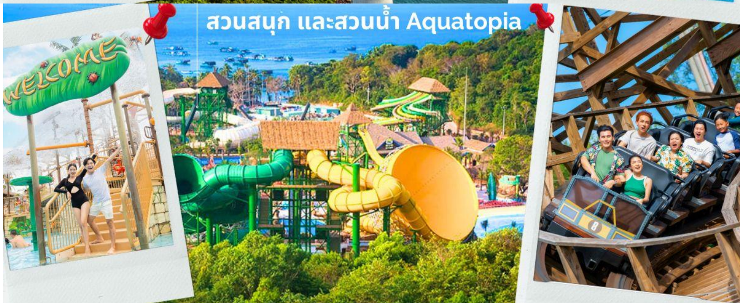
สวนสนุก และสวนน้ำ Aquatopia

จากนั้นนำท่าน ชมสวนน้ำ และสวนสนุก Aquatopia Park ที่ตั้งอยู่บนเกาะฮอนเทิม (Hon Thom) ประกอบไปด้วยสวนน้ำขนาดใหญ่ และเครื่องเล่นมากมายให้ท่านได้เลือกเล่นได้ตามใจชอบ สวนน้ำ Aquatopia ตั้งอยู่ทางตอนใต้ของเกาะฟูโก๊วก ถือเป็นสวนน้ำที่ใหญ่ที่สุดในเอเชียตะวันออกเฉียงใต้ที่มีเครื่องเล่นที่ทันสมัยมากกว่า 20 ชนิด นอกจากโซนสวนน้ำที่เหมาะสมสำหรับครอบครัวแล้ว Aquatopia Park ยังมีเครื่องเล่นที่น่า