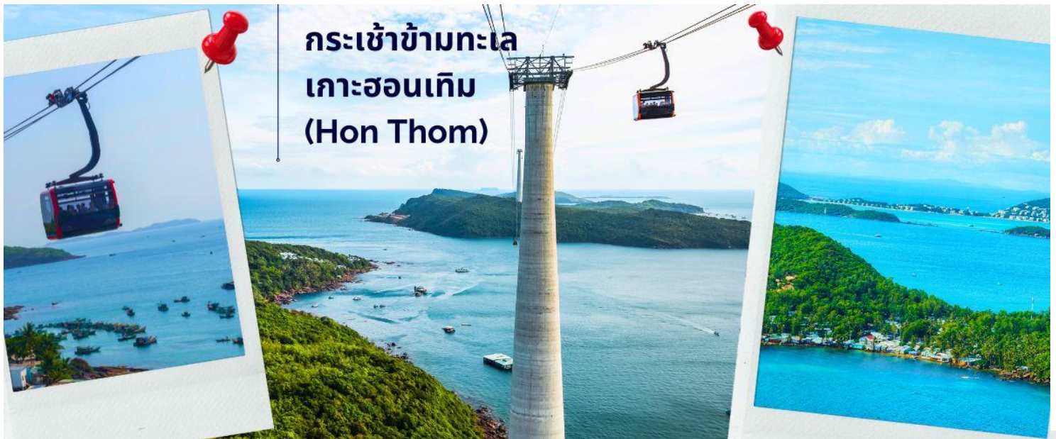
กระเช้าข้ามทะเล เกาะฮอนเทิม (Hon Thom)

นำท่านนั่ง กระเช้าข้ามทะเล Hon Thom Cable Car บรรยากาศสุดตื่นเต้นประทับใจ กับความสูงของกระเช้าและยังทอดยาว ข้ามทะเลมุ่งสู่เกาะ ฮอนเทิม (Hon Thom) เกาะที่ได้ชื่อว่าเป็นเกาะแห่งการพักผ่อนอย่างแท้จริง โดยกระเช้าแห่งนี้ได้รับการขนานนามว่า เป็นกระเช้าข้ามทะเลที่ยาวที่สุดในโลกอันดับสาม โดยมีระยะทางยาว 7,899.9 เมตร อยู่ทางฝั่งทะเลใต้ของหมู่เกาะฟูโก๊วก ตัวกระเช้าขนาดใหญ่ สามารถรองรับผู้โดยสารได้มากถึง 30 คน เคลื่อนตัวด้วยความเร็วสูงสุด 8.5 เมตร/วินาที โดยใช้เวลาประมาณ 15 นาที