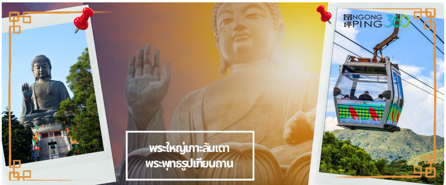
พระใหญ่เกาะลันเตา พระพุทธรูปเทียนถาน

จากนั้นนำท่านช้อปปิ้งที่ ซิตี เกท เอาท์เล็ต (CITY GATE OUTLET) เป็นเอาท์เล็ตขนาดใหญ่ที่สุดของฮ่องกง อยู่ใกล้กับสนามบินฮ่องกง ติดกับสถานีรถไฟ TUNG CHUNG STATION ซึ่งมีสินค้าแบรนด์เนมระดับโลกมากมายเป็นที่นิยมของนักท่องเที่ยวหรือแม้กระทั่งคนท้องถิ่นเอง ก็มาช้อปปิ้งกันที่นี่ นอกจากส่วนของห้างแล้วยังมีร้านอาหารต่างๆ, ศูนย์อาหาร FOOD REPUBLIC, ซูเปอร์มาร์เก็ต, โรงภาพยนตร์ และโรงแรม NOVOTEL CITY GATE HONG KONG ห้าง CITY GATE OUTLET มีแบรนด์ต่างๆให้เลือกมากกว่า 90 แบรินด์ เช่น NIKE, ADDIDAS,