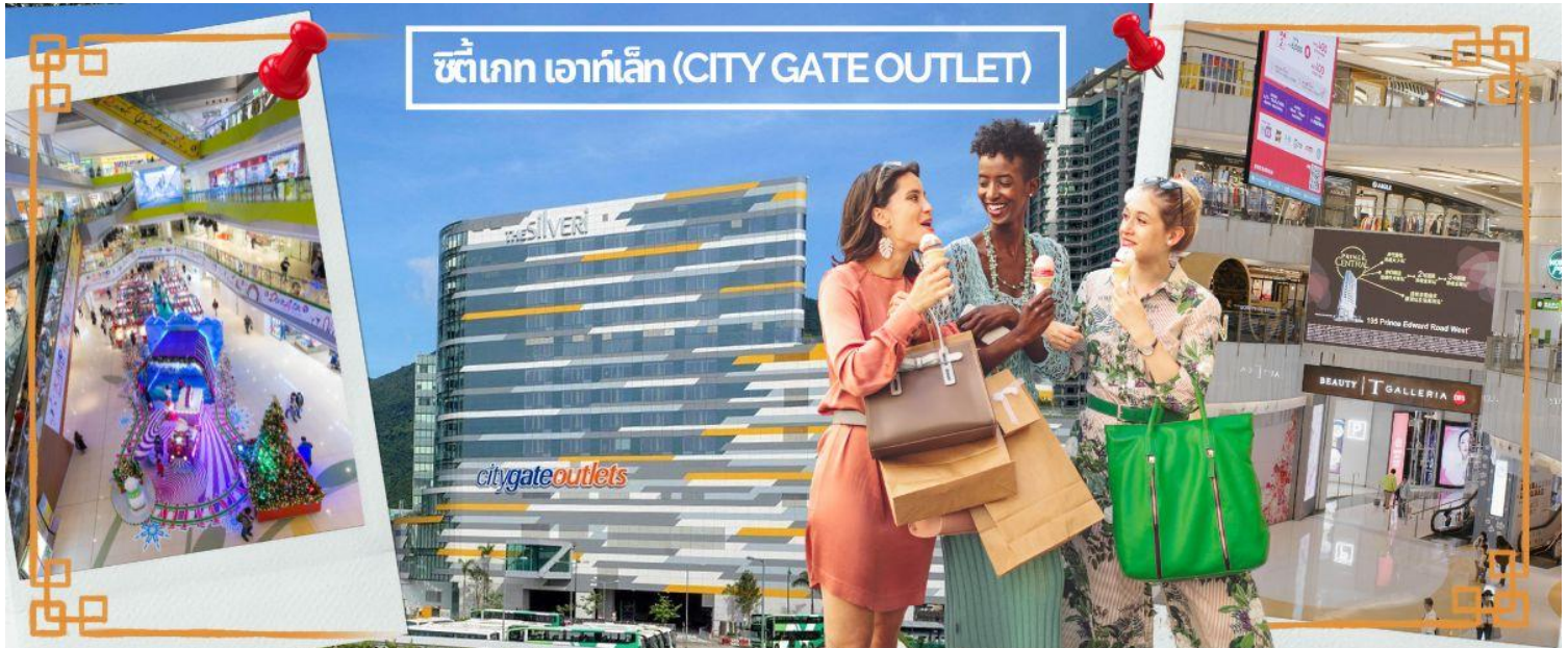
ซีทีเกต เอาท์เล็ต (CITY GATE OUTLET)

NEW BALANCE, BURBERRY, COACH, MICHEL KOR, KATE SPADE, POLO RALPH LAUREN, THE NORTHFACE, ARMANI EXCHANGE, BALLY, CROCS, COLUMBIA, ESPRIT, EVISU, GUESS, GIORDANO, LEVIS, LACOSTE, PUMA, TUMI และ TIMBERLAND ให้ท่านได้ช้อปปิ้งกันอย่างจุใจ