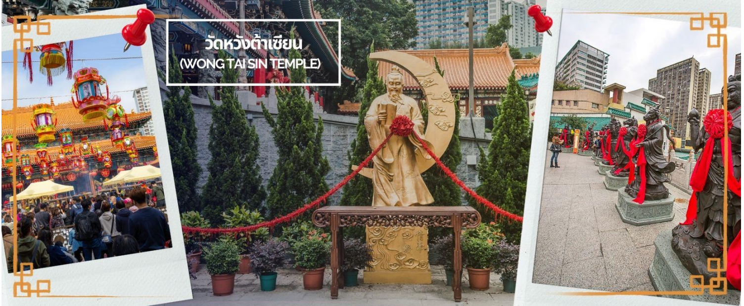
วัดหวังต้าเซียน (WONG TAI SIN TEMPLE)

จากนั้นนำท่านเดินทางสู่ วัดหวังต้าเซียน (WONG TAI SIN TEMPLE) เป็นวัดเก่าแก่อายุกว่าร้อยปี (คนจีน กวางตุ้ง จะเรียกวัดนี้ว่า หว่องไท่ซิน) ซึ่งวัดแห่งนี้เป็นที่ประดิษฐานของเทพเจ้าจีนหลายองค์ เทพเจ้าหลักของวัด