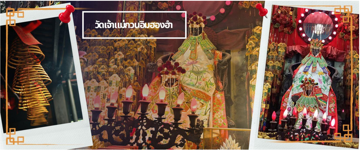
วัดเจ้าแม่กวนอิมสองฮ่า

เช้า ๑๐ บริการอาหารเช้า ณ ภัตตาคาร **เมนูติ่มซำต้นตำหรับฮ่องกง** (4)