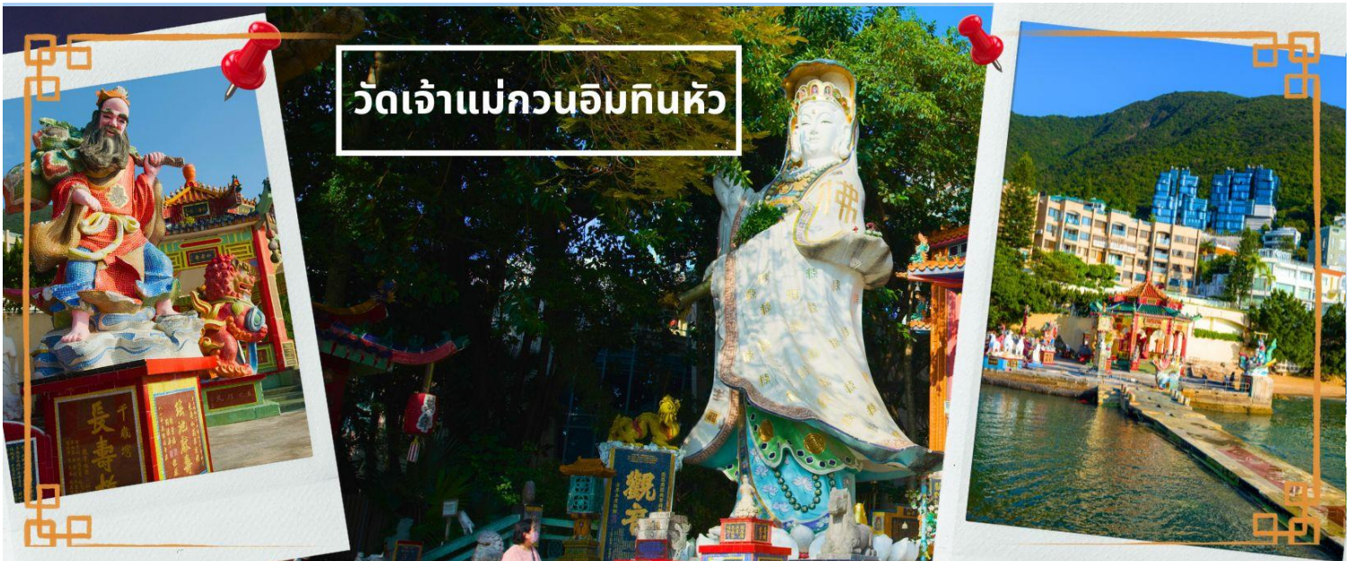
วัดเจ้าแม่กวนอิมทินหัว

จากนั้นนำท่านเดินทางสู่ วัดเจ้าแม่กวนอิมทินหัว อ่าวรีพัลส์เบย์ (TIN HAU TEMPLE REPULSE BAY) ตั้งอยู่ริมทะเล เป็นสถานที่ท่องเที่ยวสำคัญ สร้างขึ้นในปี ค.ศ. 1993 วัดแห่งนี้ถูกสร้างขึ้นเพื่อคุ้มครองชาวประมงในการออกเรือไปหาปลา ซึ่งเป็นหนึ่งในวัดที่เก่าแก่ที่สุดของฮ่องกง บริเวณวัดจะมี เจ้าแม่กวนอิมองค์ใหญ่ ปางประทานพรตั้งอยู่ เป็นเทพที่ชาวฮ่องกงและคนจีนให้ความเคารพนับถือมากที่สุด สามารถขอพรได้ทุกเรื่อง วัดนี้เป็นที่นิยมมีนักท่องเที่ยวเดินทางมาขอพรกันมากมาย เพราะเชื่อในความศักดิ์สิทธิ์ และยังมี เจ้าแม่ทับทิม หรือ เทพธิดาแห่งท้องทะเลองค์ใหญ่ ซึ่งคนฮ่องกง คนมาเก๊า และคนจีน ที่อยู่ริมทะเล ชาวประมง นักเดินเรือหรือผู้ที่เดินทางทางเรือเป็นประจำ จะนับถือเจ้าแม่ทับทิมเป็นอย่างมาก มีความเชื่อว่าเจ้าแม่ทับทิมจะปกป้องเราจากภัยอันตรายระหว่างการเดินทาง ภายในวัดยังมีเทพเจ้าและพระพุทธรูปต่างๆ ประดิษฐานไว้มากมายตามความเชื่อถือศรัทธา เช่น เทพเจ้าไฉชิงเอี้ย ไหว้ขอโชคลาภความมั่งคั่ง ความร่ำรวย, พระสังกัจจายน์โพธิสัตว์ เทพประทานบุตร-ธิดา ไหว้ขอโชคลาภลูก, สะพานต่ออายุ (สะพานอายุยืน) สะพานสีแดงตั้งอยู่บนริมหาด สีแดงสด เชื่อกันว่า คนจีนเชื่อกันว่าหากเดินข้ามสะพานนี้ เราจะมีอายุยืนขึ้นอีก 3 วัน (3 วัน บนสวรรค์ = 3 ปี บนโลกมนุษย์) นั่นหมายความว่า ถ้าเราเดินข้ามสะพานนี้แล้ว จะมีอายุยืนยาวขึ้นอีก 3 ปี บนโลกมนุษย์, เทพ