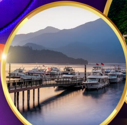
ล่องเรือทะเลสาบสุริยจันทร์