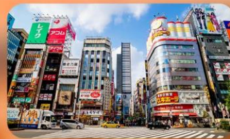
ซ้อปปิ้งชินจูกุ