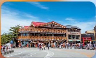
ภูเขาไฟฟูจิ ชั้นที่ 5