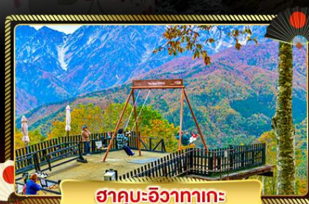
ฮาคุบะฮิวงาทาเกะ