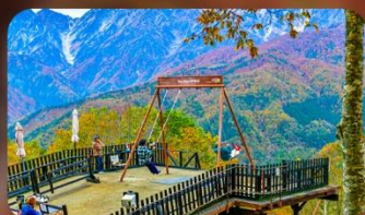
ฮาคุบะอิวาทากะ