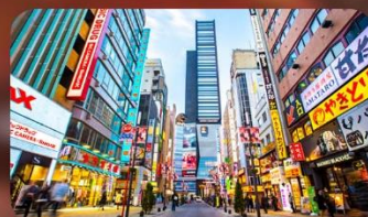
ซ้อปบั้งชินจูกุ