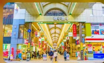
ซุปป์ิงถนนทากุทิจิ