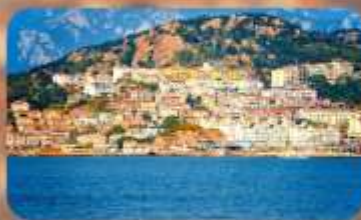
หมู่บ้านชาวประมงชาจื่อโจว