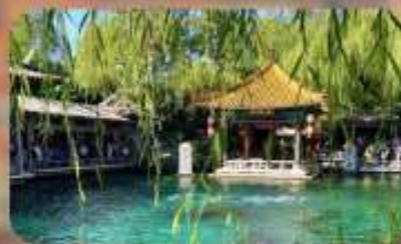
พิพิธภัณฑ์เบียร์ซิงเต่า