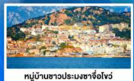
หมู่บ้านชาวประมงซาจี้โจว