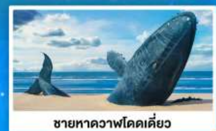
ชายหาดวาฬโดดเคี้ยว