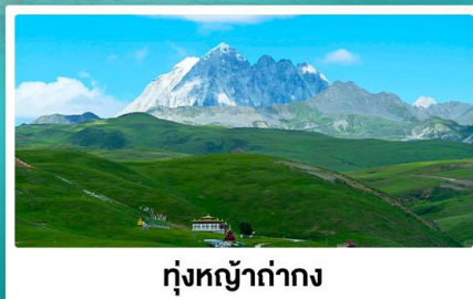
ทุ่งหญ้าย่าง