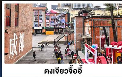
ตงเจียวจ้ออ๋