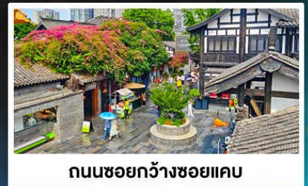
ถนนชอยกว้างชอยแคว