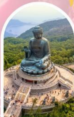
นั่งกระเชานองปิง นมัสการพระใหญ่โป่วหลิน