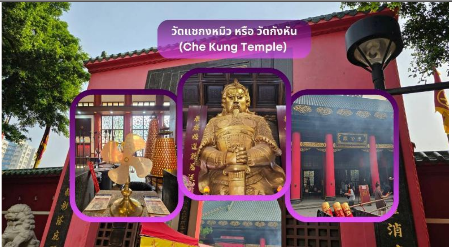
วัดแขกหมิว หรือ วัดก้งหัน (Che Kung Temple)

จากนั้นนำท่านเดินทางสู่ วัดแขกหมิว หรือ วัดก้งหัน (Che Kung Temple) ขอพรเรื่องการเดินทางปลอดภัย สุขภาพแข็งแรง โชคลาภ และเงินทอง วัดตั้งฮ่องกงที่ดังมาถึงเมืองไทย เป็นวัดที่มีประวัติศาสตร์ยาวนานกว่า 300 ปี ภายในวัดมีรูปปั้นสีทองเหลืองอร่าม ตั้งตระหง่านทั้งชายและขวา เป็นวัดศักดิ์สิทธิ์ที่มีความเชื่อในเรื่องก้งหันลม โดยความหมายของใบพัดทั้ง 4 คือ เดินทางปลอดภัย อายุยืนยาว เงินทองไหลมาเทมา และสมปรารถนาทุกประการ หากหมุนก้งหันตามเข็มนาฬิกา 3 รอบ จะพัดพาเอาสิ่งไม่ดีออกชีวิต และนำสิ่งดีๆ เข้ามาแทน