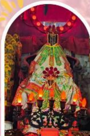
วัดเจ้าแม่กวนอิมอ่องอำ ขอพรเรื่องเงิน ทรัพย์สิน และความมั่งคั่ง