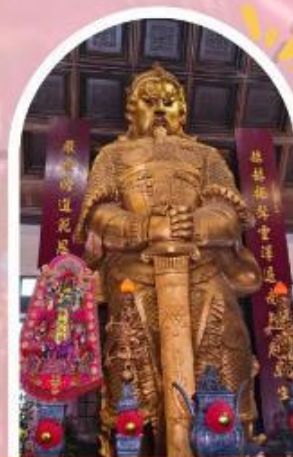
วัดแซกง ขอพรโชคลาก การเงิน และธุรกิจ