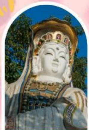
ริพลัสเบย์ รับพลังงานดี เสริมพลังดวงจัญ