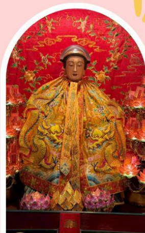
วัดหลังโหมว

ความสำเร็จ ความมั่งคั่ง เงินทองไหลมาเทมา