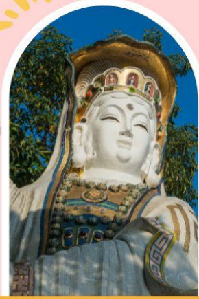
รีพลัสเบย์